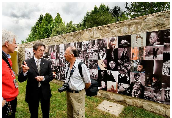
Il Presidente Merlak con il Presidente Litterio ed il Segretario Corvaia nel giardino del Centro Italiano della Fotografia d'Autore a Bibbiena