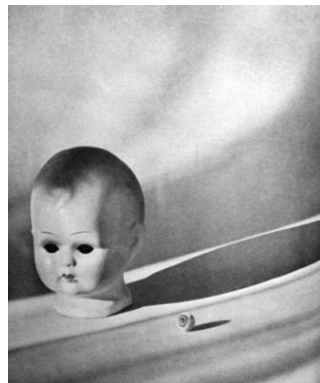
Giuseppe Cavalli, Bambola cieca , 1940