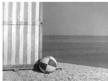
Ferruccio Ferroni, La palla , 1950