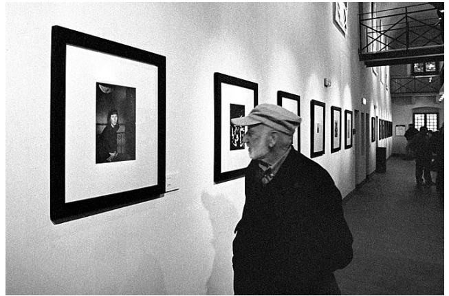
Gianni Berengo Gardin