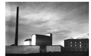
Alfredo Camisa, La fabbrica , 1952