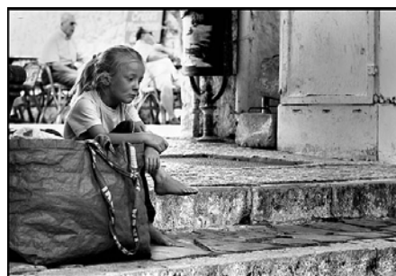
Tristezza, foto di Danilo Fiorini